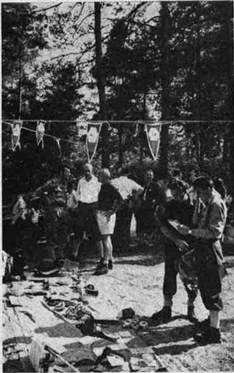
Quelques-uns des lots.