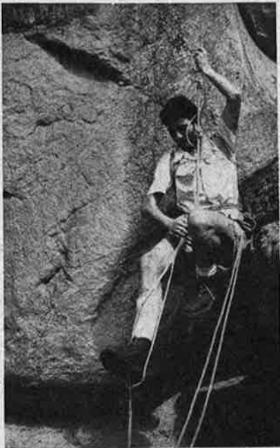
Scène d'escalade.