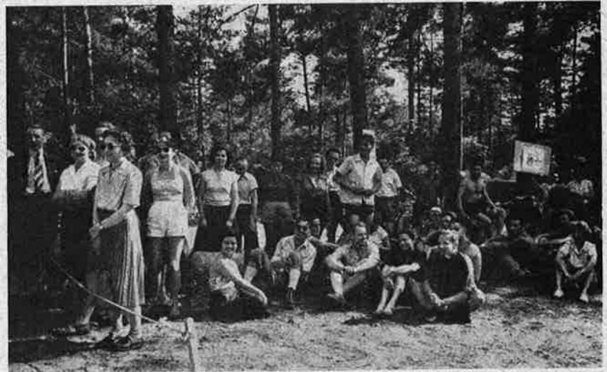
Distribution des prix.