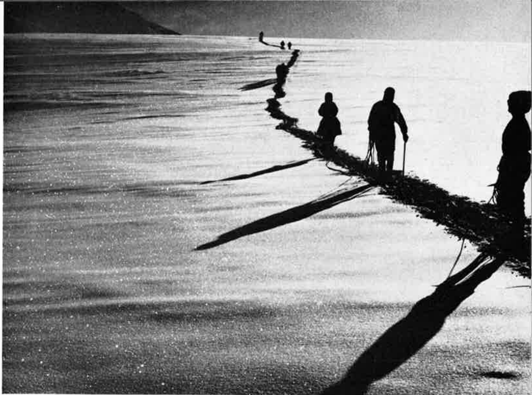
Sur le plateau du Breithorn avec ceux du camp de Morgenrot