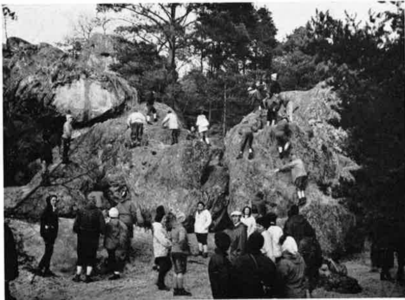
Les Rois... à l'Éléphant !