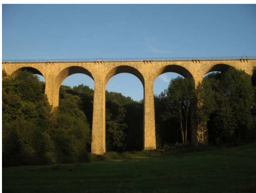
Viaduc des fauvettes