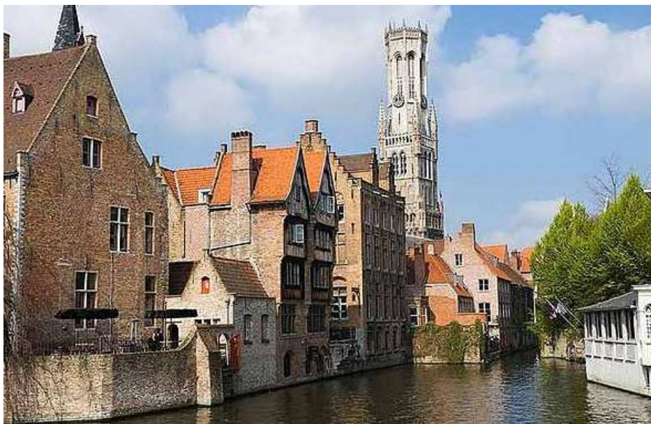
Bruges et ses canaux

Comprenant les deux nuits d'hébergements à l'hôtel et en AJ (avec les 2 petits déjeuner) avec les taxes de séjour, le transport local Ostende-Bruges en train, les frais CAF, les frais d'organisation (correspondance, téléphone, cartes, guides, réservations THALYS des organisateurs, etc..), mais ne comprenant pas les repas des midis et ceux du soir, les en-cas et boissons diverses en journée, la promenade en barque sur les canaux à Bruges en option, ainsi que les transports A/R en THALYS.