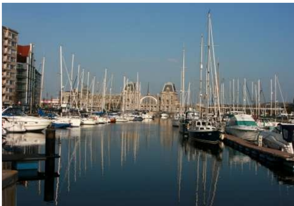
Ostende : son bassin à flot et sa gare

Un week-end pour une randonnée dans les Flandres occidentales au départ du littoral belge d'Ostende, que l'on surnomme la reine des plages, jusqu'à Bruges la Venise du Nord qui est réputée pour être le berceau de la peinture flamande et pour la fabrication de draps et de dentelle, tel sera notre programme. En fonction de la météo, à titre optionnel, une promenade en barque dans les canaux de Bruges serait envisageable.