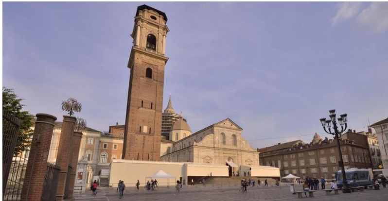
La Cathédrale de Turin (Duomo)

Un autre endroit que nous visiterons : c'est le Duomo Saint-Jean Baptiste de Turin et le Saint-Suaire (entrée libre). Après la crucifixion, le corps de Jésus fut recouvert d'un suaire en lin où une effigie apparut mystérieusement, supposée être celle du Christ lui-même. Réelle ou fausse, cette icône de la chrétienté attire les foules. La cathédrale de Turin, le dernier bâtiment Renaissance de la ville, fut érigée au XVI e siècle et a connu plusieurs rénovations depuis.