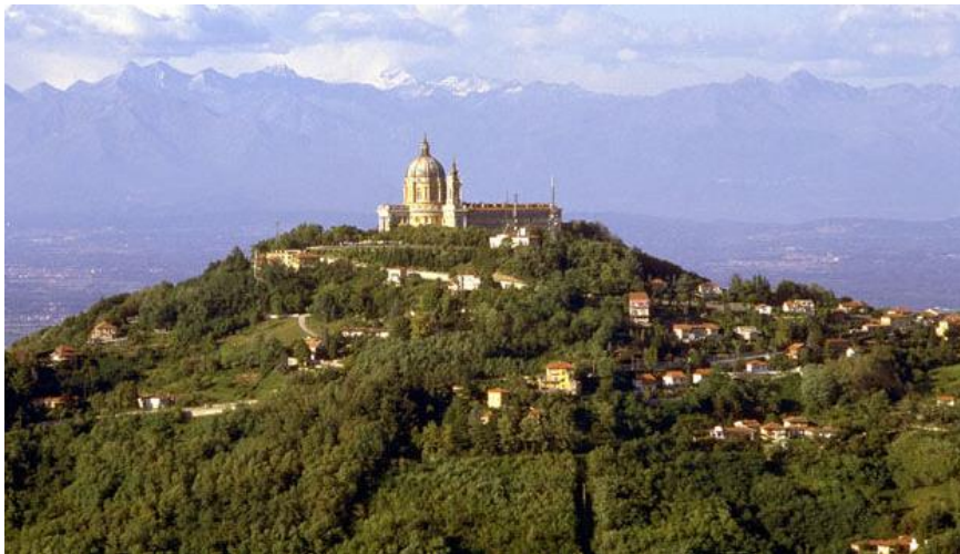
Basilique de Superga sur la colline de Turin

Nous sortirons de la ville (utilisation d'un transport local) et franchirons le Pô destination le parc régional de la colline de Superga à l'est de Turin que nous gravirons au point culminant de celui-ci (670m), lieu où se dresse la Basilique du même nom bâtie en 1717 sur lequel nous pourrions admirer le plus beau panorama des Alpes. Retour en gare de Porta Susa en transport local suivant le temps restant.