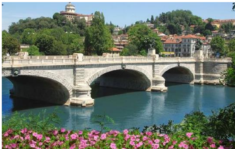
Il fiume Po a Torino (Le fleuve Pô à Turin)

Date de validation des inscriptions : vendredi 20 janvier 2017