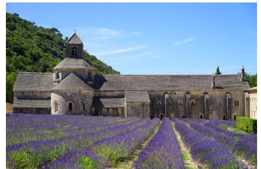
Photo non contractuelle, il n'y aura pas de lavande en octobre.