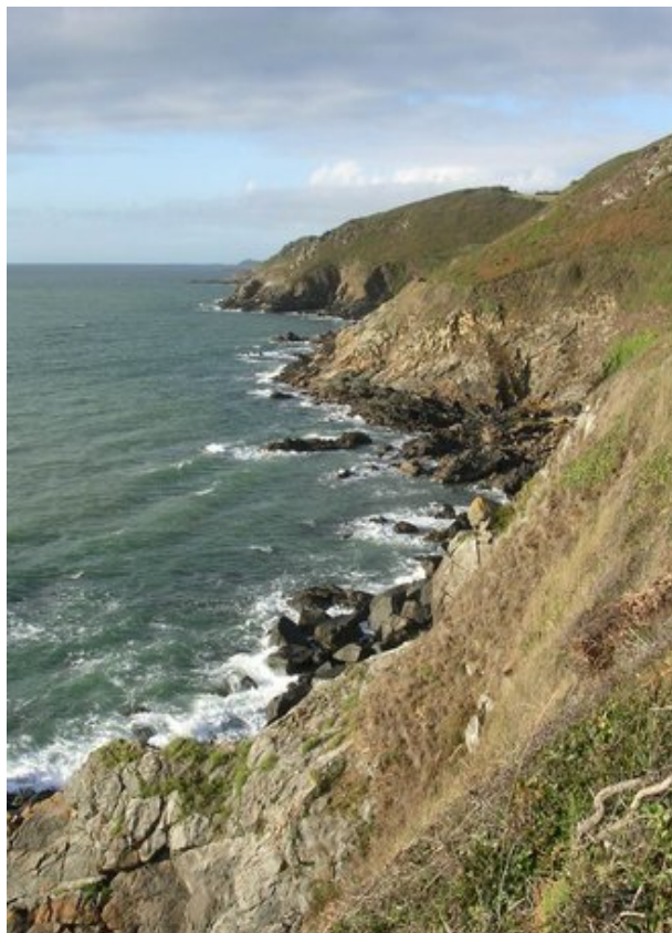
Falaises de Trédrez

Les dîners sont inclus sur place en table d'hôtes : menu unique, boissons comprises , à base de produits du terroir (et du jardin). On peut imaginer une soirée galettes sur notre billig , une soirée fruits de mer... Il faudra goûter le poisson frais local, la charcuterie d'Henriette, la saucisse de chez Ollivier à Ploumilliau, le poulet noir d'argoat, les cocos frais de Paimpol, le far et le kouign amann , un kig a farz si nous avons suffisamment marché... Les nombreuses bières locales pourront être dégustées par les amateurs qui souhaiteraient en rapporter, sans oublier le chouchen et les whiskies bretons !