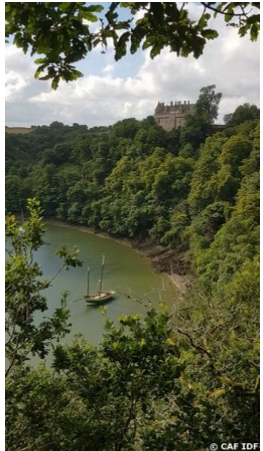
Château de la Roche-Jagu au bord du Trieux