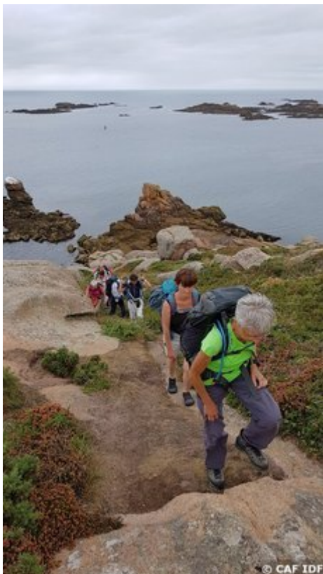
Sur l'île Milliau