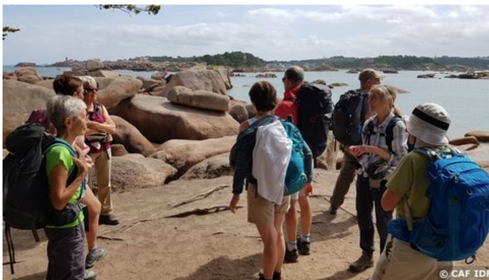
Ploumanac'h depuis Trégastel

Selon la météo et nos envies, nous pouvons prendre nos dîners sur le grand balcon terrasse dominant le jardin, sur une plage en pique-nique pour profiter du coucher de soleil sur la mer, ou en cas de tempête dans le vaste séjour.