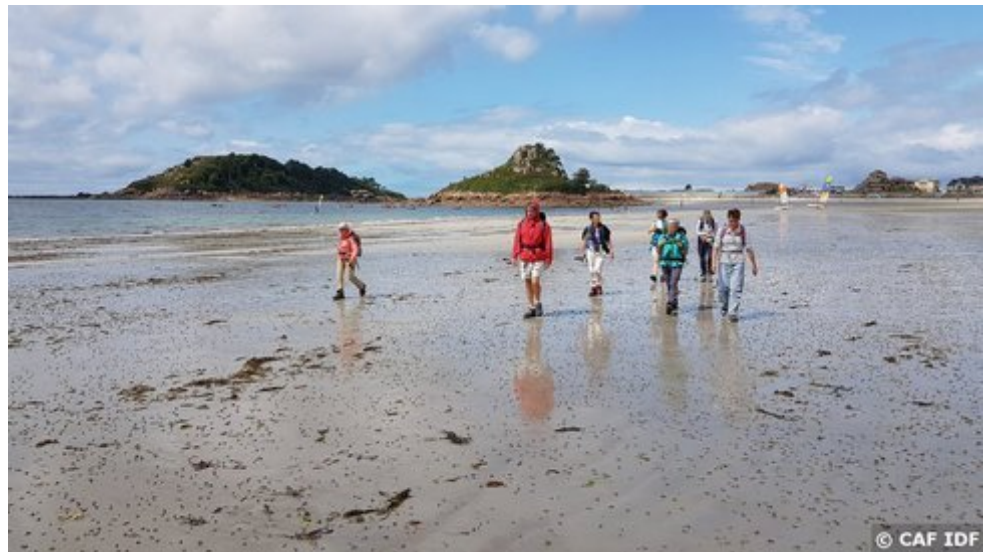
Plage à Trébeurden

Cette sortie sera adaptée aux consignes sanitaires du moment. Le passe sanitaire sera vraisemblablement nécessaire.