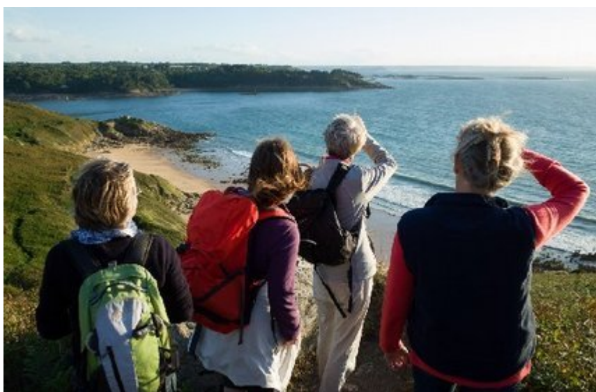
Estuaire du Léguer, pointe du Dourven depuis Beg Léguer