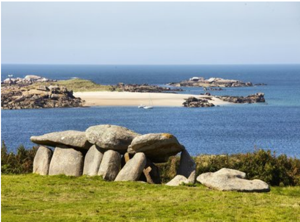
Île Molène depuis l'île Milliau

distances à ce rythme, sur des sentiers enchaînant parfois montées et descentes en petites pentes raides en bord de falaise, sur un terrain pouvant être rendu humide, glissant et érodé par la pluie, encombré de quelques ronces, orties ou fougères, et comportant de petits passages rocheux. (Ceci dit pour vous prévenir au cas où, mais nous serons aussi souvent sur des sentiers entretenus et touristiques !)